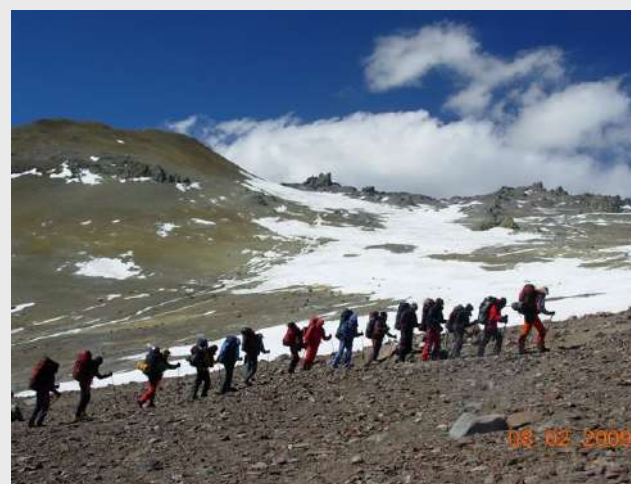
Uspon na Nido