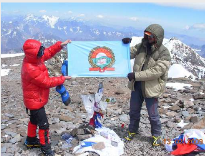
Pobeda na vrhu