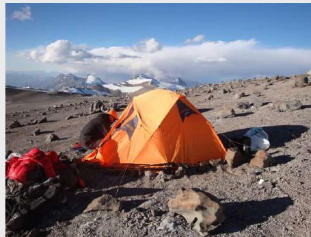
Soko u gnezdu kondora