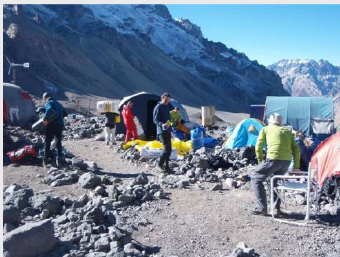
Pripreme za povratak

Dan zaljubljenih... i silaska u bazu... Prvo do Nida, pokupili đubre koje smo tamo ostavili, pa do baze. Od nas 23 popelo se 14... od toga je 5 odustalo nakon Berlina, što Miloš kaže da je nezapamćeno, jer su do sada svi koji su stizali do Berlina izlazili na vrh. On je ocenio našu grupu izvrsnom što se tiče fizičkih sposobnosti, ali nešto nije štimalo, vreme, pritisak, šta li..... U bazi, nema nekog odmora, pakujemo stvari koje idu na mule i spremamo se za sutrašnji silazak u civilizaciju.