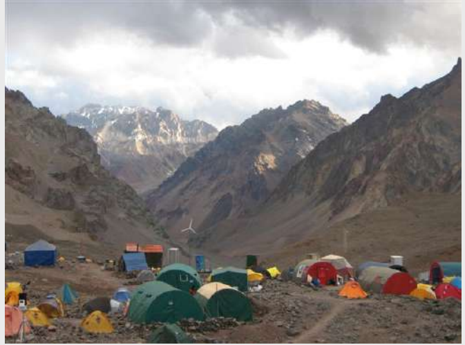
Plaza de Mulas

Bilo mi je super, bar prva 2 sata, a onda se pešačenje pretvorilo u tihu patnju i mislili smo da nikad nećemo izaći iz te doline. Nije joj bilo kraja, nizale su se okuke, pa okuke iza okuka... i tako. Nekome pade na pamet, članak jednog od učesnika prošlih ekspedicija pod nazivom "Akonkagva, predvorje pakla", nisam čitao, ali sam se prepoznao. Napokon, izlaz iz doline i tabla koja kaže još 4 sata, već smo tabanali 6, pa nas je obradovala vest da smo prešli pola, barem. Takođe je redovalo to što smo najzad dobijali na visini, pa gubili i tako u krug, sve do napuštene kasarne Argentinske vojske (zbrisala je lavina) gde smo došli do završnog uspona pred kampom. Konačno Plaza de Mulas, premoreni počeli smo užurbano da dižemo šatore, ali kako je zašlo sunce (logor je naravno u rupi) počela je da me trese groznica, jedva nekako potražih spas u vreći za spavanje.