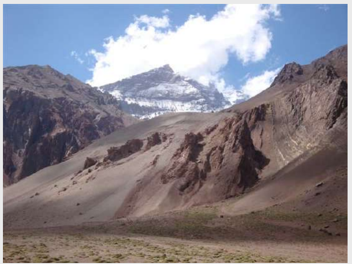
Poslednji pogled na Akonkagvu

Krenuli, pa i nema mnogo, samo nešto preko 30km do autobusa.... U podnožju zadnjeg uspona pred bazu, dve mule leže raspadajući se, često stradavaju, zato je prevoz mulama tako skup... Za mene, možda i najteži dan u ekspediciji, isprva, dok sam bio odmoran i nije bilo teško, pa potom, sunce koje prži, pa umor, pa sneg koji nas je šibao, i na kraju ispod 3300m i kiša, a noge boleeeeeeeee.... jedva nekako. Pokupili nas minibusevi, na ulasku u park, pa u Penitentes. Te večeri, alkohol i hrpe govedine (a vegetarijanci, neke travke), druženje, srećni su bili i oni što su se popeli i mi što nismo, ipak smo prošli puno toga.