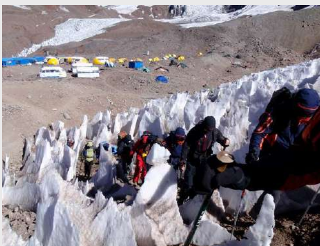
Penitentesi na putu za Nido