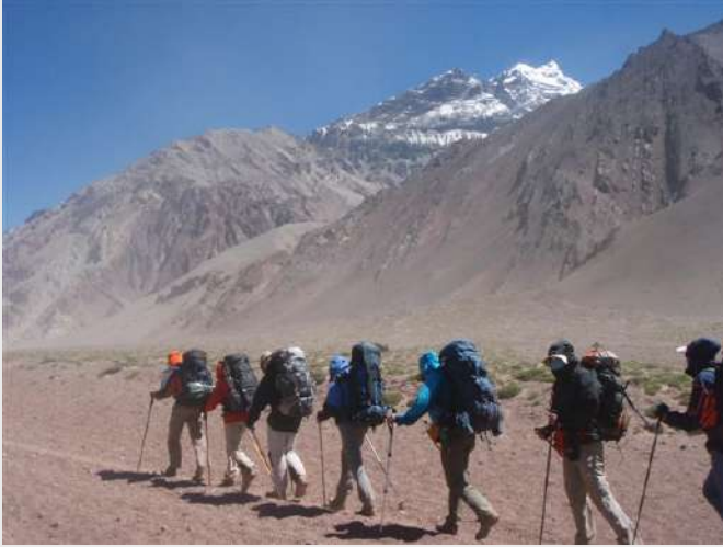
Put na jug

Dan predviđen za jedan od tri najteža poduhvata koji nas očekuju; prelazak sa velikim rančevima do Plaza de Mulas, uspon od 1300m (zbog gubljenja visine) ali zato 18km, većinom opet kroz pustinju. Već naviknuti, počeli smo mackanje kremom protiv sunca (50+ faktor, minimum) koju smo bogoradili sve vreme na planini, naočare za sunce sa opet maksimalnom mogućom zaštitom koje nismo ni skidali za sve vreme osim u šatoru kad legnemo na spavanje, zaštita preko lica kako je ko umeo, jer su nas peščane oluje opet pratile i taj dan i polako krenusmo. Polako od Confluensie nizbrdo, pa preko rečice Horcones, pa uz nju uzbrdo uz kanjon, do jedinog izvora na putu. Tu smo dopunili vodu i nastavili, putem su nas prestizali mnogi koji ili su već bili aklimatizovani ili nisu znali da ne treba toliko žuriti, pa smo ih sretali unezverene kasnije. Dalje smo išli širokim vijugavim putem dolinom Horconesa, koji nismo ni videli veći deo puta. Duvao je sada već jak vetar, puneći prašinom sve nepokrivene delove tela, a i neke pokrivene.